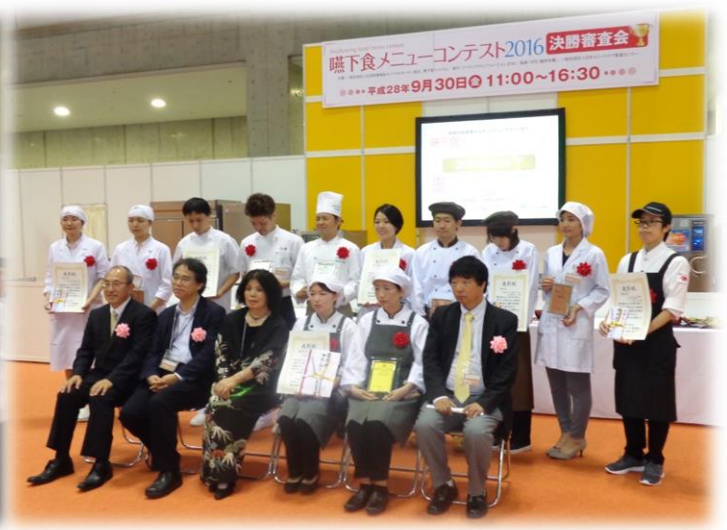
最後に全員で写真をとりました

栄養価が高く、食べやすく、香りもよく、介護食素材を上手に使って作ったことが評価されました