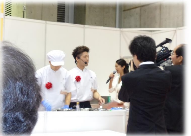
インタビューを受けながらの説明