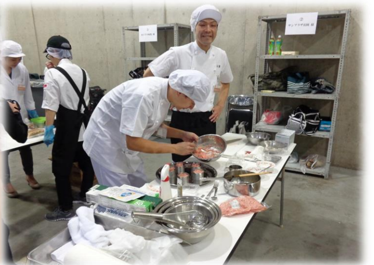
バックヤードで準備