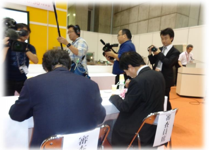
実際に試食をしながらの審査