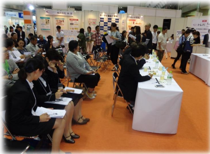
大勢の参加者と審査員