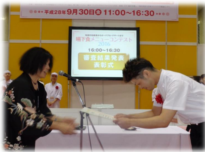
結果 一般料理部門 部門大賞受賞

栄養価が高く、食べやすく、香りもよく、介護食素材を上手に使って作ったことが評価されました